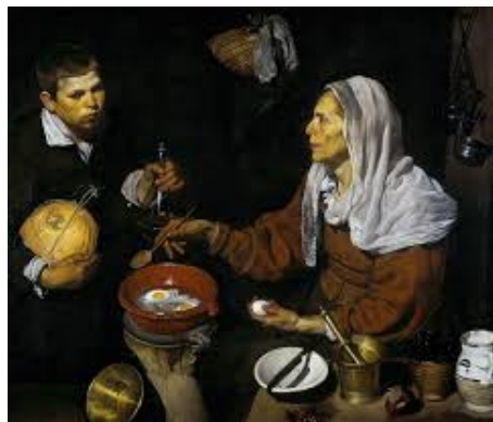
Vieja friendo huevos